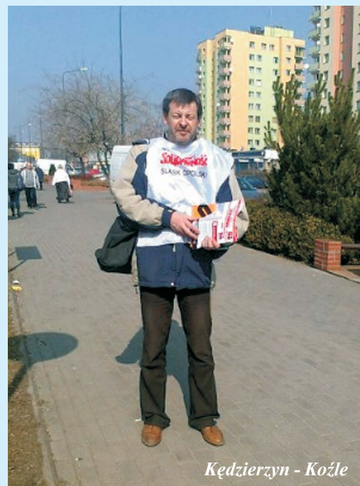
Kędzierzyn - Koźle

Biuletyn informacyjny „S” Zarządu Regionu Śląska Opolskiego