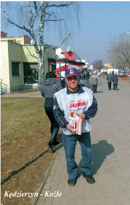
Kędzierzyn - Koźle