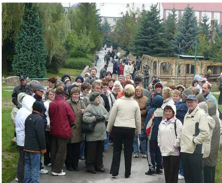
Sanktuarium Matki Bożej Bolesnej Pani Świętokrzyskiej w Kałkowie-Godowie