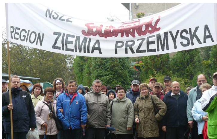
Pielgrzymi z Regionu Ziemia Przemyska NSZZ „Solidarność” u Jasnogórskiej Pani