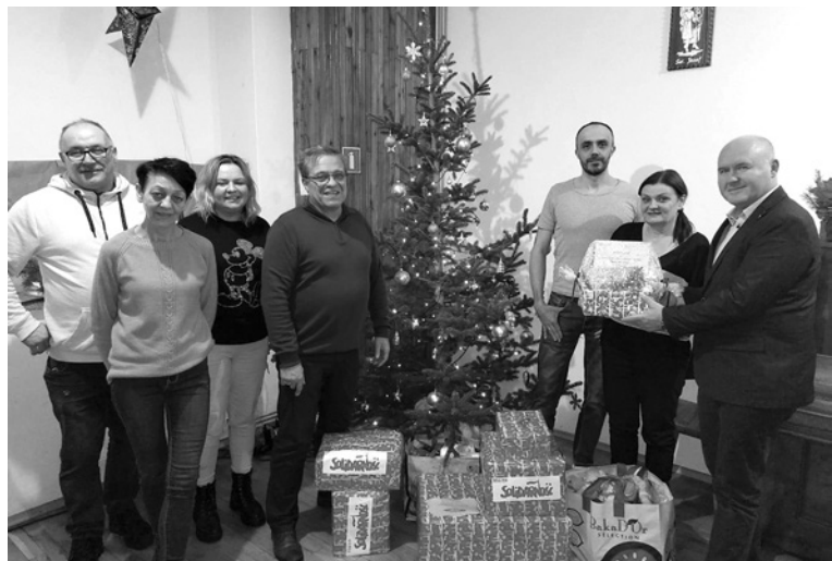
Zarząd Regionu „S”