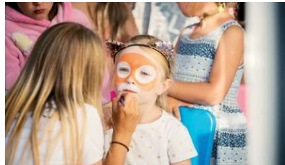
Animacje dla dzieci