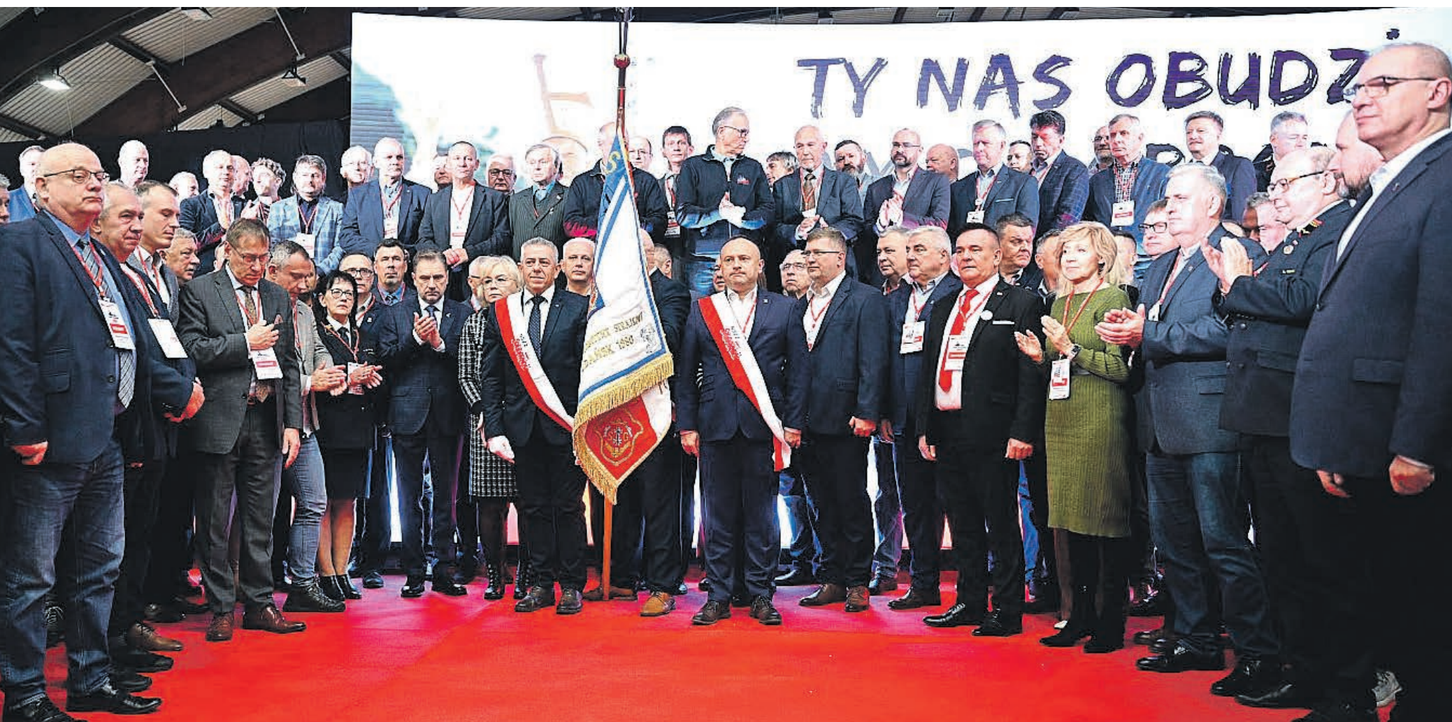
Delegaci Komisji Krajowej złożyli ślubowanie na sztandar Związku.