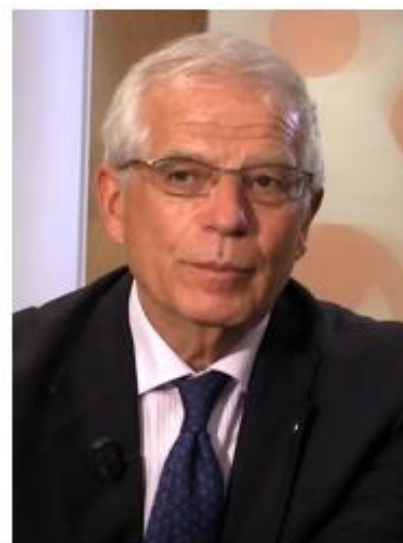
Josep Borrell Fontelles