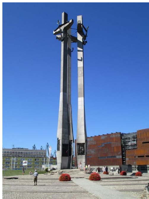
Pomnik poległych stoczniovców