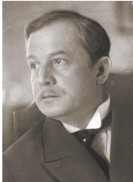
Wojciech Korfanty 17

W 1918 roku sprawa niepodległego bytu Polski właściwie była już przesądzona. Przywódcy państw Ententy deklARowali przekonanie, że komponentem nowego ładu europejskiego powinna być Polska. Szczególnie ważne było noworoczne orędzie prezydenta Stanów Zjednoczonych Woodrowa Wilsona, w którym wskazywał, że powinno być stworzone niepodległe państwo Polskie i z dostępem do morza. W pełni formalne potwierdzenie tych deklaracji nastąpiło w 1919 roku, po powołaniu rządu Ignacego Paderewskiego, 15 stycznia Polska zostaje zaproszona do udziału w konferencji pokojowej.