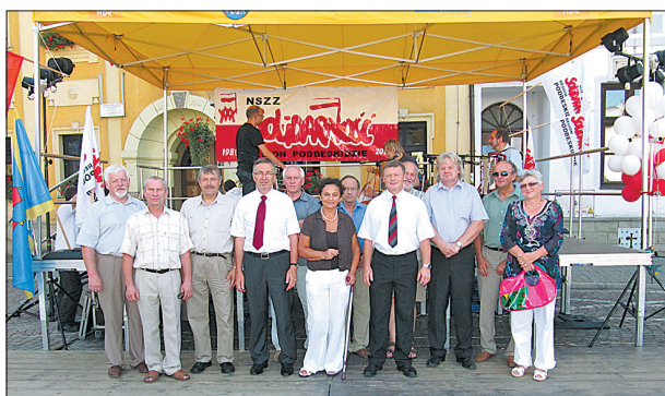
W Skoczowie jednym z punktów jubileuszowych uroczystości był rodzinny piknik, zorganizowany 14 sierpnia na Rynku.