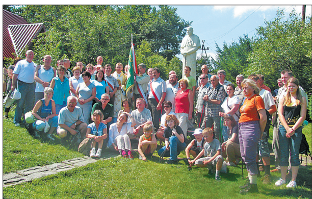
„Solidarność” Podregionu Sucha Beskidzka zorganizowała 14 sierpnia związkowy rajd na Groń Jana Pawła II.

● 25 września 2010: godz. 15.00, Skoczowskie Centrum Promocji „ART-adres” - uroczyste spotkanie jubileuszowe z zasłużonymi działaczami NSZZ „Solidarność”, połączone z otwarciem wystawy.