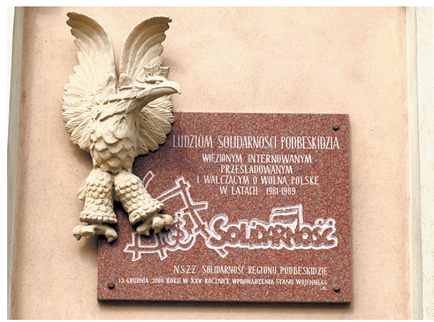
Tablica, upamiętniająca ludzi Solidarności, więzionych, internowanych, prześladowanych i walczących o wolną Polskę w latach 1981-1989, znajdująca się na zewnętrznej elewacji kościoła pw. Opatrzności Bożej, odsłonięta 13 grudnia 2006 roku.