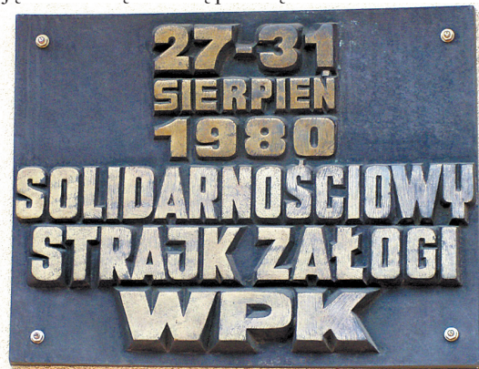
Tablica, upamiętniająca solidarnościowy strajk załogi WPK, znajdująca się na budynku dyrekcji MZK przy ul. Długiej 50, odsłonięta 31 sierpnia 1981 roku.

Świętując trzydziestą rocznicę powstania NSZZ „Solidarność” wspominamy najnowszą historię naszej Ojczyzny, naszego regionu i miasta - historię, w której „Solidarność” zapisała się złotymi zgłoskami. W Bielsku-Białej o tamtych wydarzeniach przypominają mieszkańcom trzy pamiątkowe tablice, które znaleźć możemy w różnych punktach miasta. Niedawno, z inicjatywy Zarządu Regionu Podbeskidzie NSZZ „Solidarność” i Urzędu Miejskiego w Bielsku-Białej wojewoda śląski wpisał te tablice do wojewódzkiego rejestru upamiętnień i miejsc pamięci. Tym samym zostały one objęte formalną ochroną prawną.