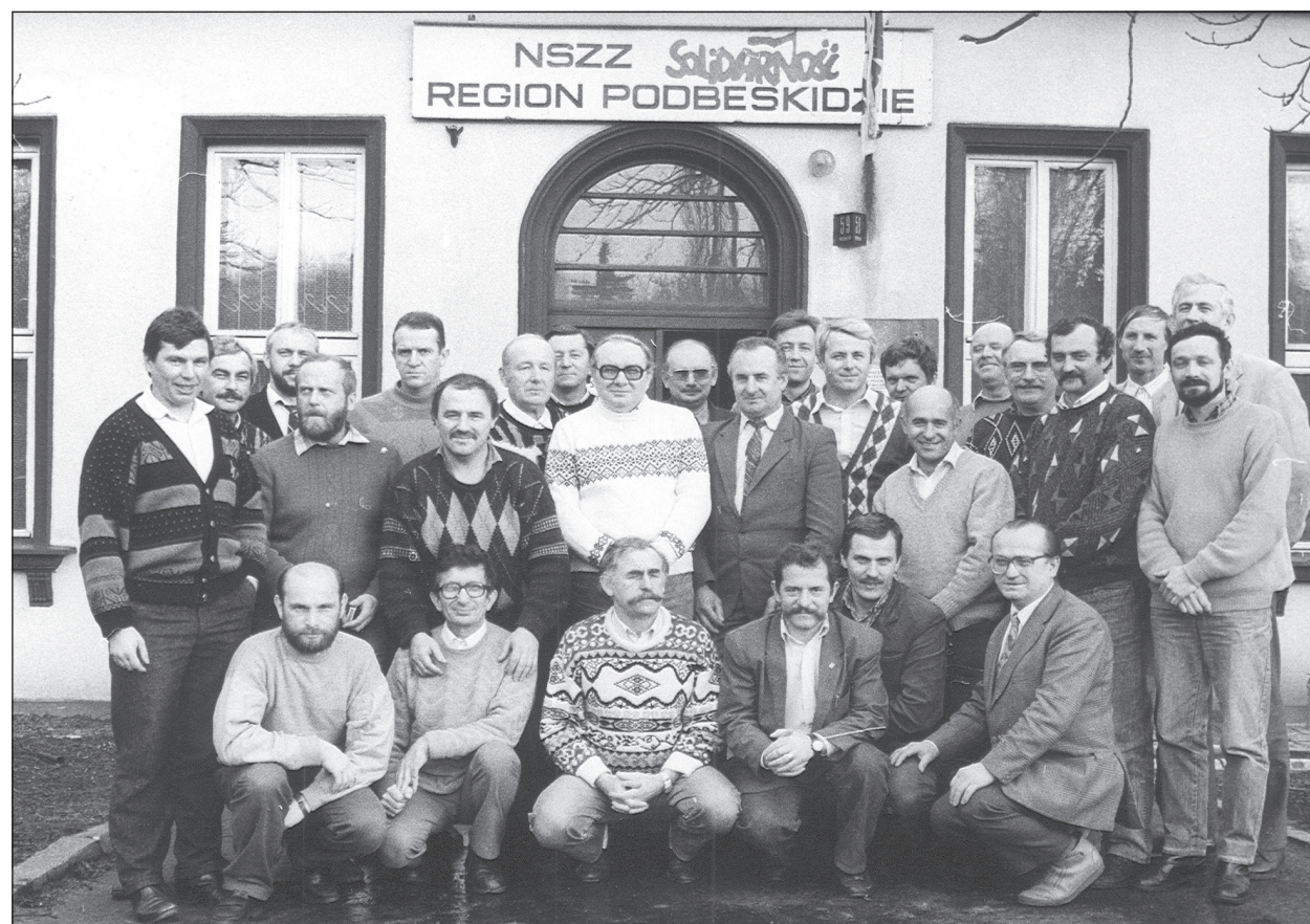
Pamiętkowe zdjęcie członków podbeskidzkiego Zarządu Regionu NSZZ „Solidarność” przed ówczesną siedzibą ZR przy ulicy Partyzantów 59.