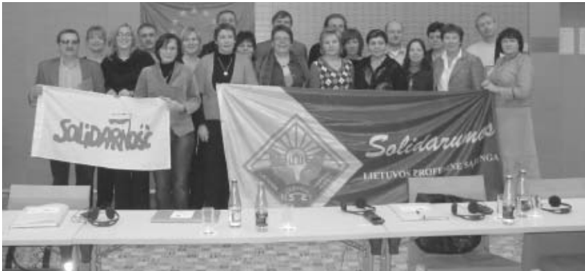
Polsko-litewskie szkolenie w Druskiennikach na temat równouprawnienia płci.

Kobiety stanowią ponad 52 proc. zasobów siły roboczej w Polsce, i ponad 38 proc. członków NSZZ „Solidarność”. Jak wyrównać ich szanse? Obecnie 56,3 proc. kobiet w UE jest zatrudnionych (przy 70,9