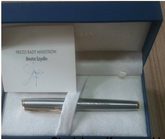
Prezesa Rady Ministrów Beata Szydło