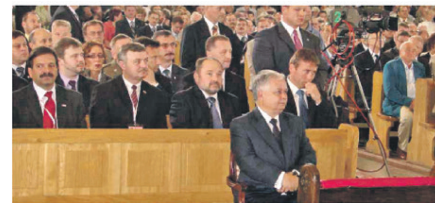
Prezydent Lech Kaczyński podczas mszy św. honorowanej w 29 rocznicę wydarzeń w Lubinie.