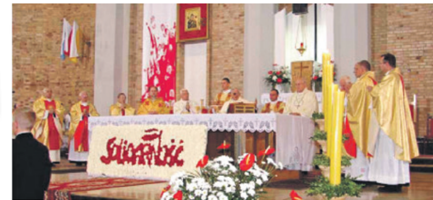
Msza św. odprawiana w 29 rocznicę zbrodni lubińskiej.

W albumie są akcenty z naszego regionu. Kilka zdjęć w wydawnictwie jest autorstwa Wojciecha Obremkiego.