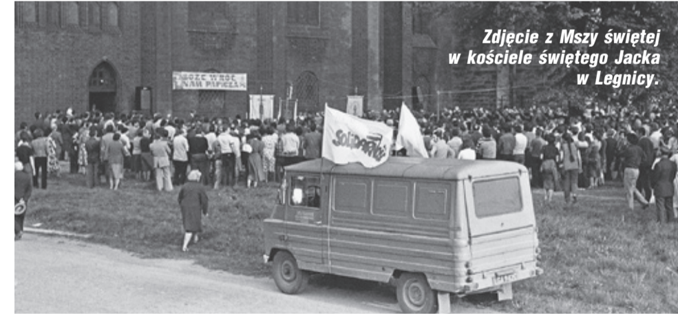
Zdjęcie z Mszy świętej w kościele świętego Jacka w Legnicy.