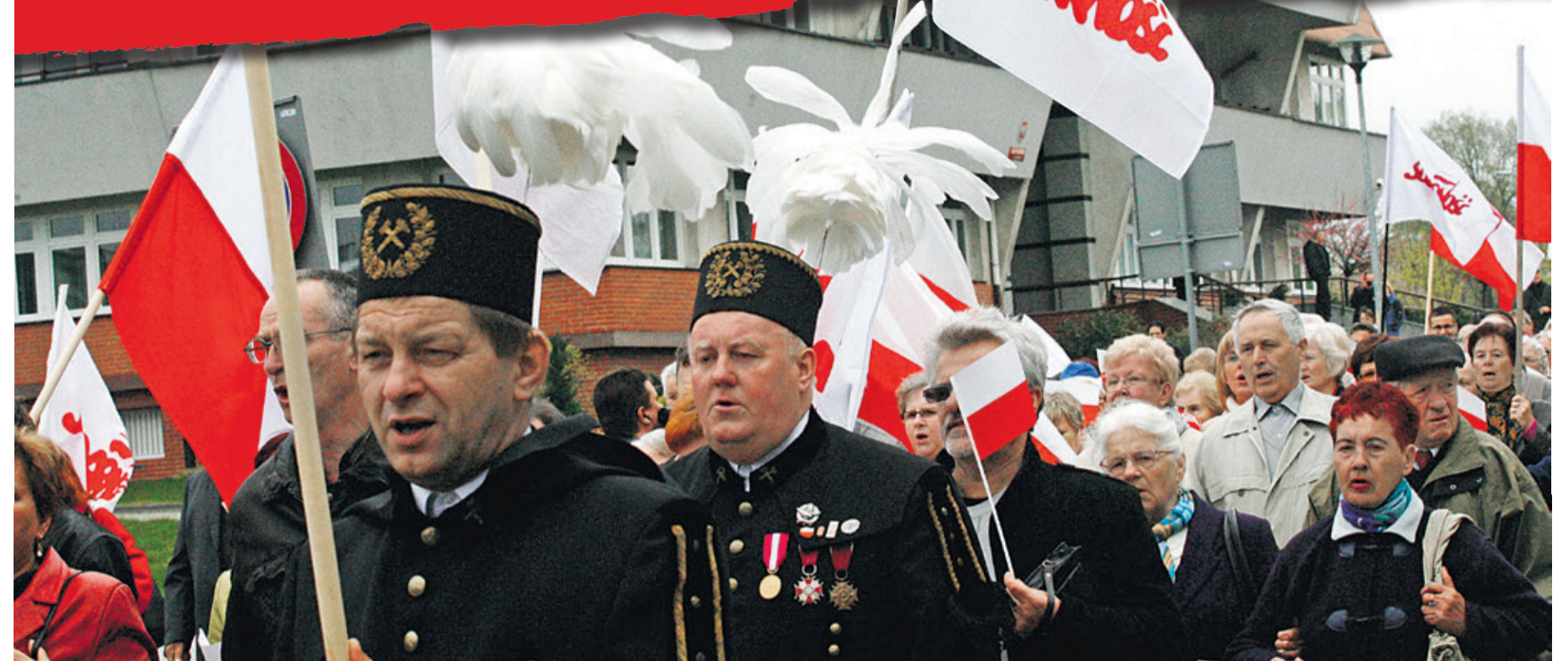
Ponad tysiąc osób uczestniczyło w Lubinie w marszu o wolne media.

Manifestanci nieśli transparenty, wznosili okrzyki broniące mediów niezależnych. Skandowano hasła: „Cala Polska z was się śmieje