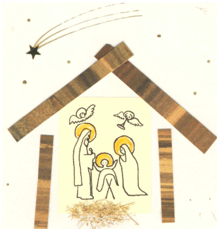
Projekt Maria Gołębiewska

„Wiadomości KSN” są dostępne na stronie internetowej KSN On line pod adresem: http://www.solidarnosc.org.pl/~ksn