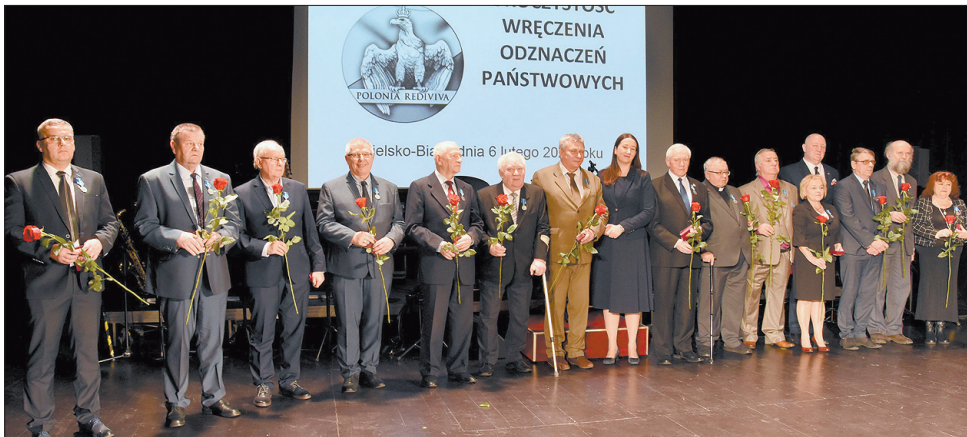
Pamiątkowe zdjęcie osób odznaczonych 6 lutego w Bielsku-Białej prezydentkami Medalami Stulecia Odzyskanej Niepodległości.

Członkowie podbeskidzkiej „Solidarności”, a wraz z nią znamienici goście, oddali hołd uczestnikom strajku generalnego z 1981 roku. Główne uroczystości odbyły się 6 lutego, dokładnie w 39. rocznicę podpisania porozumienia, kończącego tamten protest.