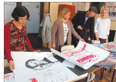
Jurorzy podczas oceniania prac nadesłanych na II Regionalny Konkurs Plastyczny.